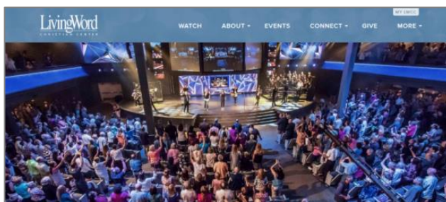
تصویر ۶- تصویر بالای صفحه اصلی وبگاه Living Word Christian Center