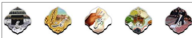
تصویر ۳- نمونه کاربرد نقوش هنر اسلامی در وبگاه الشیعه

شاخصه کاربرد رنگ‌های هنر اسلامی، در ۴ نمونه مشاهده می‌شود؛ می‌توان گفت در هنر اسلامی هر رنگ، دارای مفاهیم بسیاری است که از اعتقادات و باورهای دینی در فرهنگ اسلامی سرچشمه می‌گیرد (عسگری و اقبالی، ۱۳۹۲: ۶۱). رنگ سبز در سنت اسلامی یادآور پیامبر (ص) و سیادت است (موسوی‌گیلانی، ۱۳۹۳)، آبی روشن، سبز-آبی، لاجوردی و زرد طلایی نیز رنگ‌های