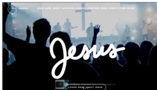
تصویر ۱۳- بخشی از صفحه اصلی وبگاه Fellowship Bible Church

به لحاظ کاربرد تصویر اماکن مقدس، تنها وبگاه newlifecyclechurch صحنه‌هایی از فضای بیرونی و خدمات و مراسم در فضای داخلی کلیسا را در قالب تصاویر نمایش می‌دهد. تصویر روحانیون نیز در سه وبگاه Hillsong، newlifecyclechurch و lwcc دیده می‌شود و در تمام نمونه‌ها به‌غیر از وبگاه fellowshiponline، نمایش اجرای مراسم مذهبی در تصویر بزرگ بالای صفحه اصلی آورده شده است. در تمام این تصاویر، جمعی از افراد در حال خواندن سرود مذهبی در پس‌زمینه نورانی به تصویر درآمده‌اند که می‌تواند حس مذهبی و نور ایمان را تداعی کند و به موضوع مذهبی وبگاه اشاره می‌کند.