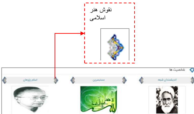
تصویر ۲- نمونه کاربرد نقوش هنر اسلامی در وبگاه الشیعه