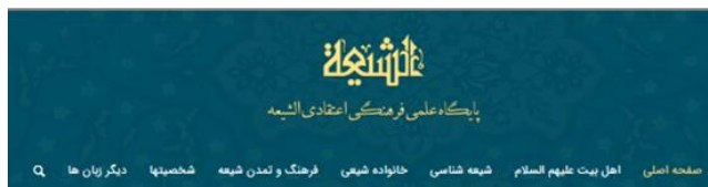
تصویر ۴- نمونه کاربرد رنگ‌های هنر اسلامی در وبگاه الشیعه

غالب در معماری مساجد هستند که در ایجاد فضای معنوی و روحانی بسیار مؤثر بوده‌اند (شایسته‌فر و خمسه، ۱۳۹۲: ۲۸) علاوه بر آن تجلی نور در بسیاری از هنرهای اسلامی نظیر تذهیب و کاشی‌کاری با رنگ طلایی نشان داده شده است (عسگری و اقبالی، ۱۳۹۲: ۵۱). بدین ترتیب رنگ آبی در وبگاه حدیث نت، آبی تیره (لاجوردی) و رنگ طلایی در وبگاه الشیعه (تصویر ۴)، همچنین رنگ سبز در وبگاه Dawat-e-Islami، رنگ‌های غالب در صفحه هستند که بر مذهبی بودن این وبگاه‌ها تأکید دارند. علاوه بر آن در هر سه نمونه، استفاده از این رنگ‌ها در آرم وبگاه و نوشته‌های عنوان‌های اصلی به ارتباط بصری و هماهنگی در صفحه کمک کرده است. در وبگاه Islamicity نیز از رنگ سبز در نوشته‌های عنوان‌های اصلی هر قسمت استفاده شده است؛ اما رنگ‌های موجود در پس‌زمینه و سایر قسمت‌های صفحه با هویت اسلامی ارتباطی ندارند.