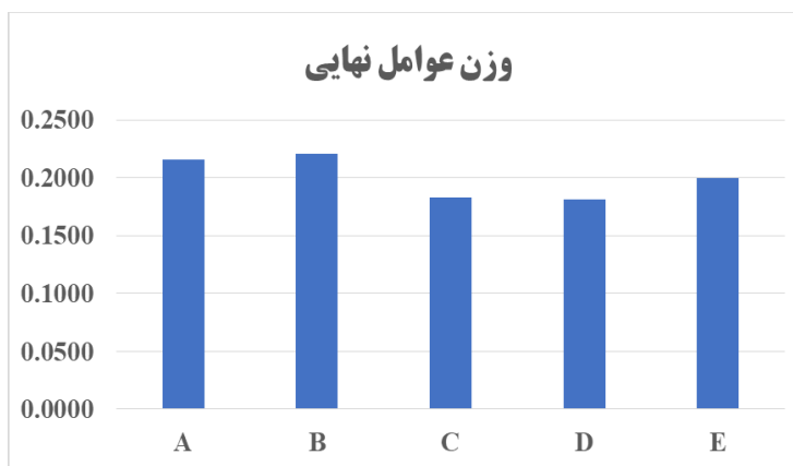
شکل (۱) نمودار مقایسه وزن نهایی مضامین فراگیر عوامل ارتباطی و راهبردی در شکل گیری رضایتمندی مشتریان از خدمات پس از فروش خودرو