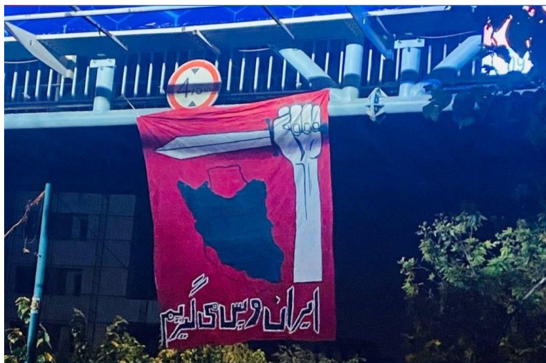
تصویر ۴. تصویری از نصب بنرهای اعتراضی از روی پله‌های مشرف بر اتوبان‌ها.

شعار دادن از پنجره‌ها به سوی خیابان، و برداشتن روسری‌ها در شهر (تصویر ۵) همگی نشان از رخدادی است که می‌خواهد در مرزهای ملاءعام اسلامی تحول ایجاد کند. ۱ از آنجایی که جمهوری اسلامی تشکیل سرزمینش را بر روی دوش تشکیل ملاءعام اسلامی قرار داده است، پس با تغییر مرزهای ملاءعام اسلامی به طور مستقیم در سرزمین جمهوری اسلامی هم تحول ایجاد می‌شود و این خط قرمزی است که بر سر آن نبردی ایجاد شده است.