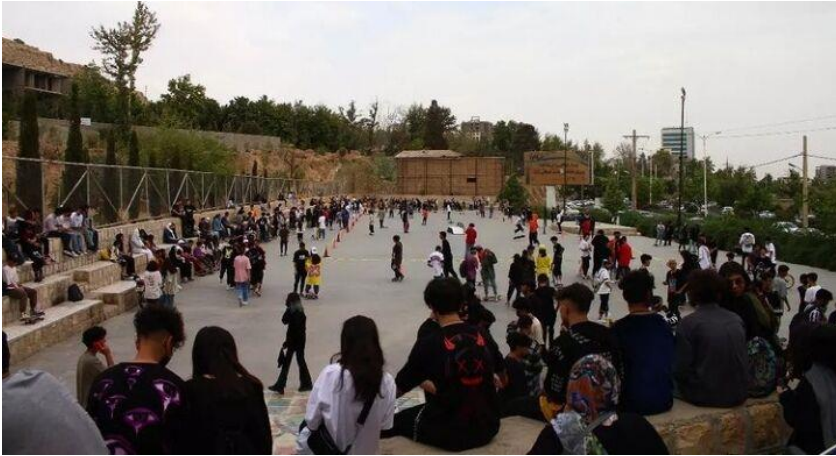
تصویر ۳. مراسم مختلط روز جهانی اسکیت بورد در بلوار شهید چمران شیراز و کشف حجاب در آن. (تابناک، ۱۴۰۰)

بنابراین، میل برای فتح ملاءعام اسلامی میلی با شدت‌های مختلف در بین نسل‌های مختلف پس از انقلاب ۵۷ بوده است. میل فتح ملاءعام اسلامی هر چه به نسل‌های جدیدتر می‌رسد شدت بیشتری یافته است، زیرا نسل‌های قدیمی‌تر این میل را به نسل‌های جدیدتر منتقل کرده‌اند ۱ . نسل‌های قدیمی‌تر هرچه قدر جلوتر آمده‌اند آمادگی بیشتری را پیدا کرده‌اند که شاهد بروز و ظهور ارزش‌های متفاوت سبک زندگی در نسل‌های جدیدتر باشند ۲ . اگر بخواهیم دلیلی را