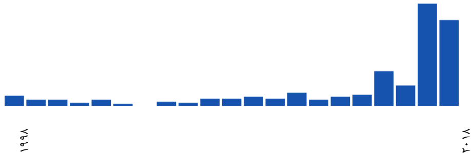
نمودار ۰ - ۳. روند انتشار نوشته‌ها با/ درباره خلاصه همگان فهم

اگرچه مفهوم خلاصه همگان فهم در همه انواع مدارک علمی هست، ولی همان‌گونه که در نمودار ۰ - ۴ نمایش داده شده است پایه شواهد به‌دست‌آمده از مطالعه منابع گوناگون، روشن شد که خلاصه‌های همگان فهم بیشتر در انواع رایج انتشارات کاربرد دارند.