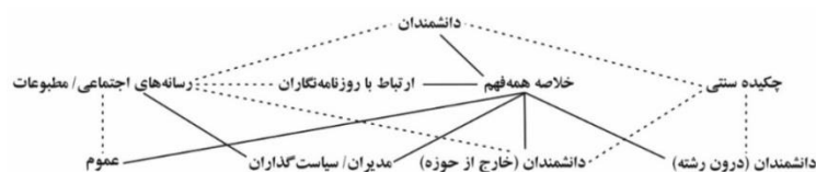
نمودار ۰-۲. مسیرهای ایجاد ارتباط با یافته‌های پژوهشی

خلاصه‌های همگان فهم از مقالات منتشر شده می‌توانند موجب تسهیل ارتباط میان گروه‌های گوناگون علمی و غیرعلمی شوند. نمودار ۰-۲ مسیرهای موجود برای ایجاد ارتباط با نتایج پژوهشی بین دانشمندان و کاربرد از طریق سازوکارهای متفاوت را ترسیم می‌کند (خط‌های نقطه‌چین). خلاصه‌های همه‌فهم از مقالات منتشر شده که به‌منظور بهبود مسیرهای ارتباطی ممکن (خط‌های صاف) بین دانشمندان و عموم افراد کار می‌کند، دسترسی سیاست‌گذاران را به اطلاعات افزایش داده و ارتباط میان‌رشته‌ای را بهبود می‌بخشد.