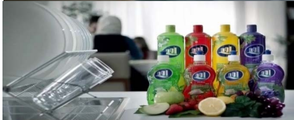
تصویر شماره ۱: سکانس‌های تبلیغ تجاری مایع ظرف‌شویی آوه