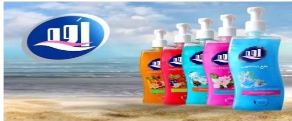
تصویر شماره ۲: سکانس‌های تبلیغ تجاری مایع دست‌شویی آوه