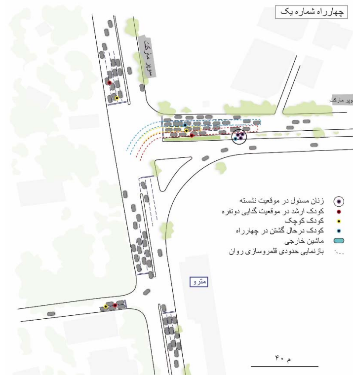
تصویر شماره ۲: موقعیت‌ها دور گران در چهارراه

چهار راه پر بار بودن خود را حفظ کند، کودکان برای خود موازینی وضع کرده‌اند تا از پس این موقعیت پرقابلیت بر بیایند. یکی از قواعد مقرر در چهارراه توسط کودکان، «اسم آوردن» است.