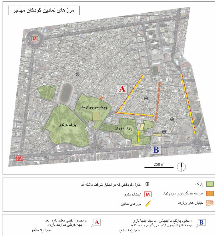
تصویر شماره ۱: نقشه‌ی توصیفی محله‌ی هنری