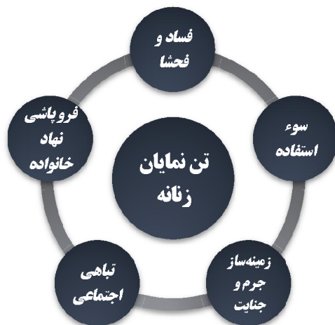
نمودار شماره ۲۰. مفصل‌بندی گفتمان مقاومت

همچنین فروپاشی نهاد خانواده را از پیامدهای جامعه‌ای می‌داند که در آن امر جنسی به واسطه حضور تن‌نمایان زنان به سرعت در حال انتشار است. «۲۰ هزار قربانی کوچولوی طلاق، چنان سخاوتمندانه اجازه می‌دهیم که فیلم‌های سینمایی و تلویزیونی و هنرنمایی‌های پاره‌ای از مطبوعات و کاباره‌ها و مانند آن‌ها همه سرمایه‌های ما را غارت کنند و جوانان و حتی بزرگسالان ما را به ابتذال بکشند، که هیچ آدم غافل و بی‌خبری چنین نمی‌کند...» (مکتب اسلام، ۱۳۵۲: شماره: ۳).