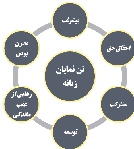
نمودار شماره ۱۵. مفصل‌بندی گفتمان پهلوی

به‌عنوان نمونه مجله زن روز مسابقه دختران شایسته را به‌عنوان نشانه‌ی رهایی از عقب‌ماندگی و پیشرفت معرفی می‌کند «دختران، آوای پیروزی از دور به گوش می‌رسد!... مسابقه انتخاب دختران شایسته ایران که یک رقابت مشروع و هیجان‌انگیز و سازنده برای درهم شکستن عقب‌افتادگی‌ها و عقده‌های زن حرم‌سرای است با شوق و رغبت استقبال می‌کند» (زن روز: ۱۳۵۴، ش: ۶۷۳). یا مجله اطلاعات بانوان برهنه شدن را وسیله‌ای برای احقاق حق زنان می‌داند «۱۵۰ زن لخت شدند که حقوق خود را از مردان بگیرند!» (اطلاعات بانوان، ۱۳۵۰: ش: ۷۴۰). همچنین در تیتیری ویژگی مهم یک کشور مدرن و پیشرفته را آزادی جنسی و برهنگی زنان معرفی می‌کند «در سرزمینی که سکس مرزی ندارد! در سرزمینی که هر دو دقیقه یک هواپیما را می‌پذیرد، حتی یک لباس دوخته شده از پرچم بر اندام خانم‌ها دیده نمی‌شود» (همان، ۱۳۵۱: ش: ۷۹۴).