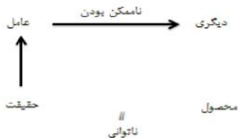
شکل ۱: طرح عمومی گفتمان از منظر لکان

بر مبنای انفصال ناشی از ناممکن بودن، به اصطلاح عامل با میلی به پیش می‌رود که حقیقت او را می‌سازد. اما چون این حقیقت نمی‌تواند به طور کامل به زبان درآید عامل هیچ گاه نمی‌تواند به طور کامل میلش را به دیگری منتقل کند. عامل با یک میل ناممکن روبروست. اهمیت این ناممکن بودن در این است که لکان نشان می‌دهد هر پیوند اجتماعی بر اساس گرد هم جمع شدن سوژه‌ها حول یک میل ناممکن است.